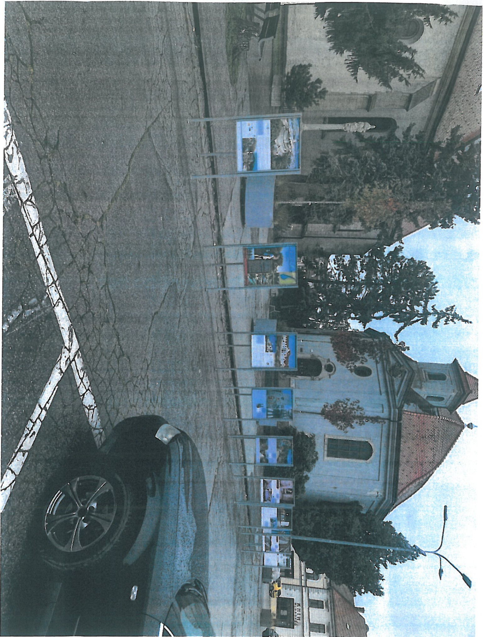
PUTOVNÁ VÝSTAVA – HLOHOVEC