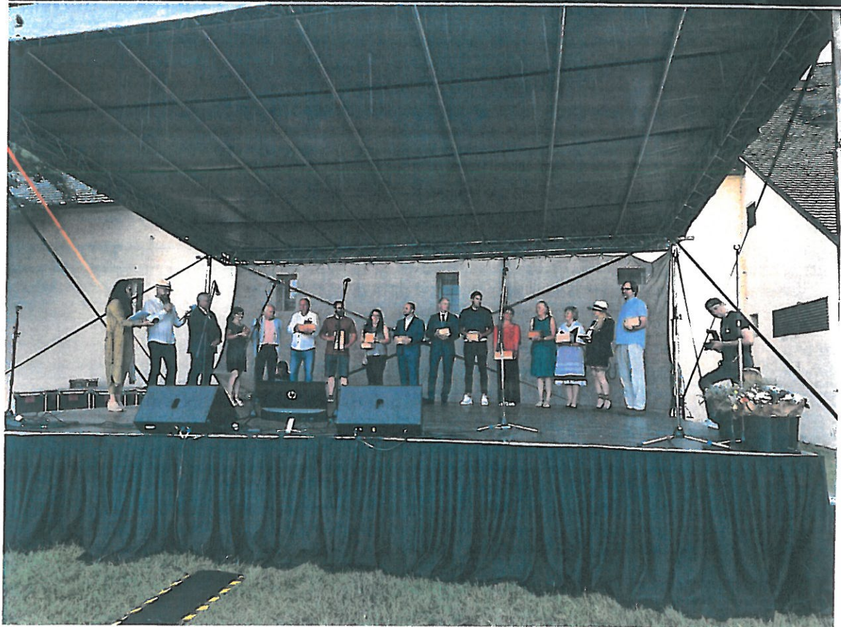
1 OTVORENIE – BŘEVNOVSKÝ KLÁŠTER, PRAHA