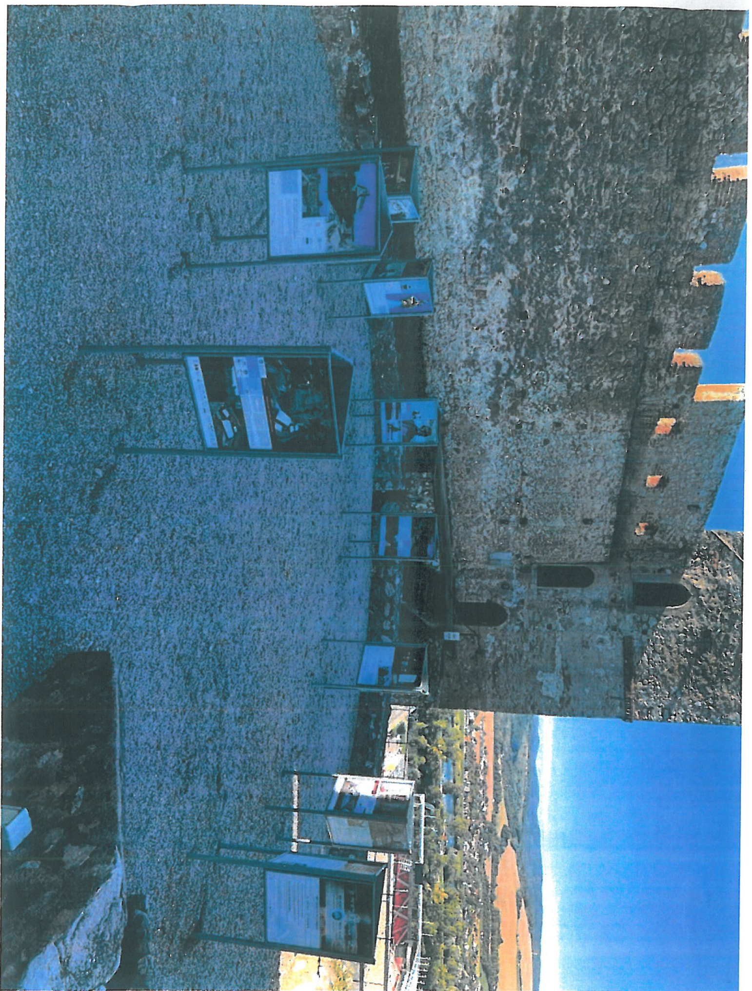
PUTOVNÁ VÝSTAVA – TREŇČIANSKY HRAD