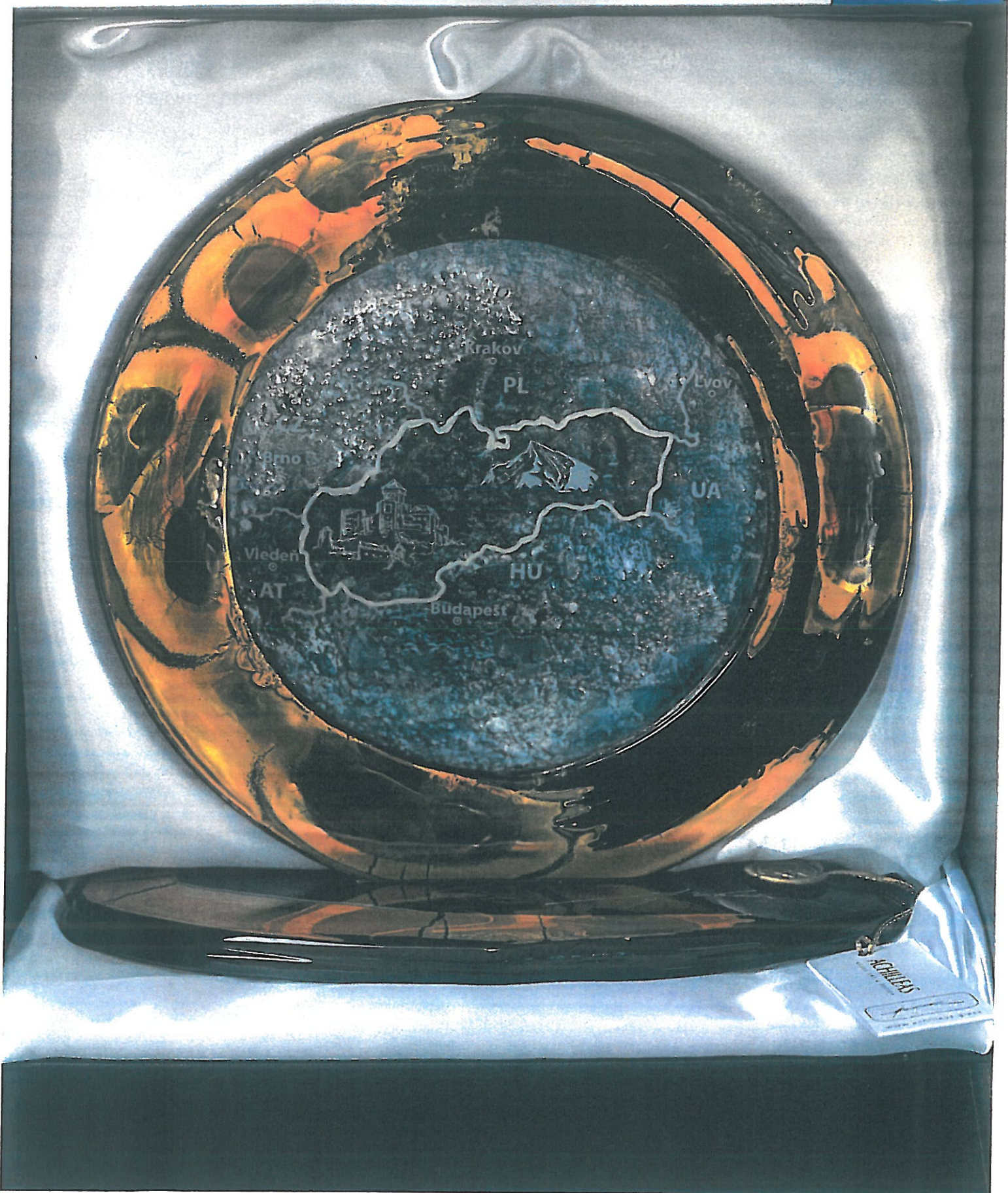
OCENENIE – „SLNKO VLASTI“